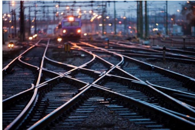
Frekventa och icke frekventa katastrofer