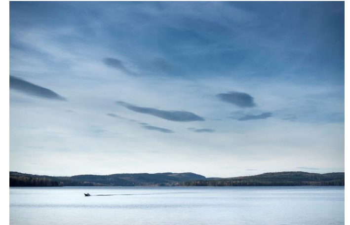
Plötsliga och långsamma katastrofer