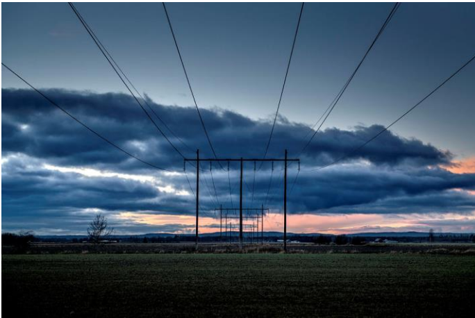
Små och storskaliga katastrofer